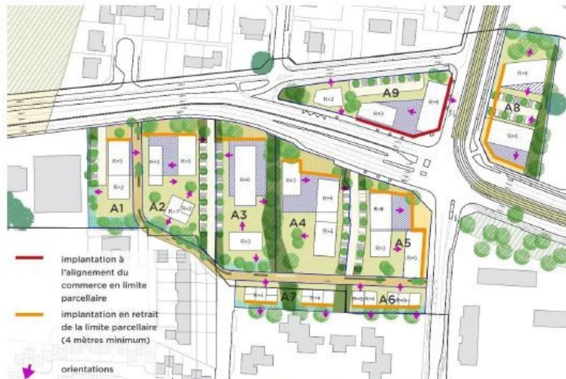
Figure 6 : Principes d'implantation du secteur Kennedy (COUAPE, décembre 2016)