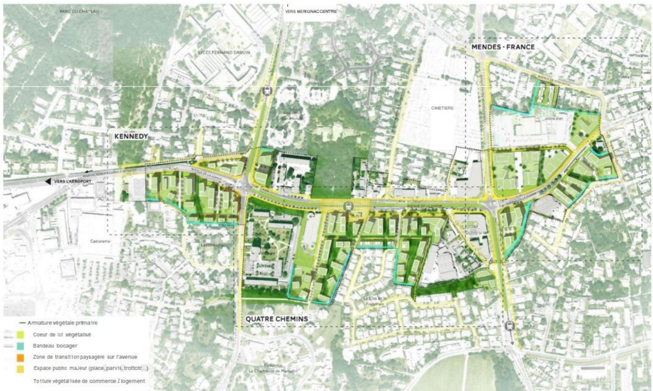
Plan de masse du projet

Il aboutira à terme à la réalisation de 22 276 m 2 de commerces et de 1 100 logements, permettant l'accueil d'environ 2 200 habitants. L'opération réserve une part importante de logements bénéficiant des dispositifs conventionnés ou sociaux (35 % de logements locatifs sociaux, entre 10 à 15 % en accession abordable et entre 10 à 15 % en accession sociale).