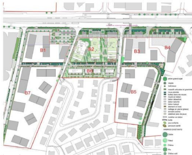
Figure 7 : Plan d'aménagement du quartier des Quatre Chemins (source : notice AVP de Martin Duplantier Architectes, juin 2017)

Sources : Évaluation environnementale - Opération d'aménagement urbain "Mérignac Marne" - p. 11 résumé non technique