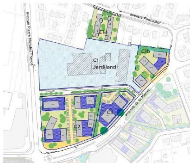
Figure 8 : Plan d'aménagement du quartier Mendès-France Nord (source : notice AVP de Martin Duplantier Architectes, août 2017)

Sources : Évaluation environnementale - Opération d'aménagement urbain "Mérignac Marne" - p. 11 résumé non technique