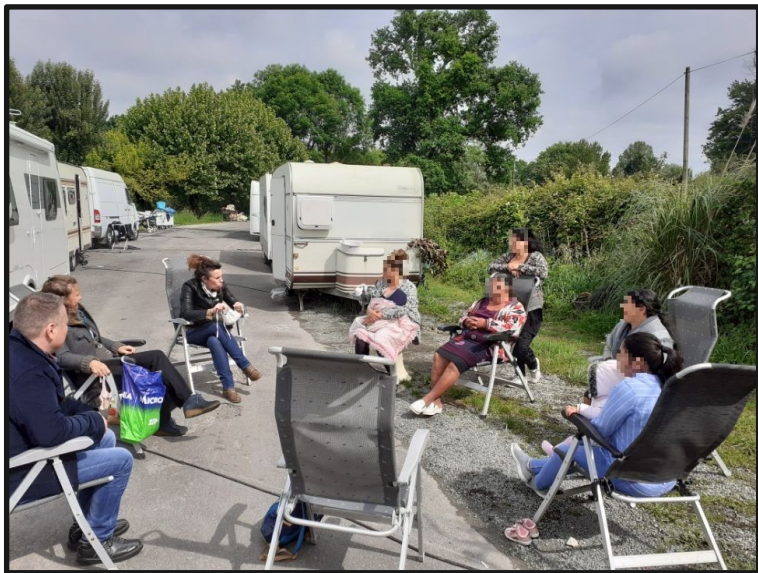
Sensibilisation à l'usage des masques et distribution ADAV33 / MSF Stationnement précaire de Tresses, mai 2020