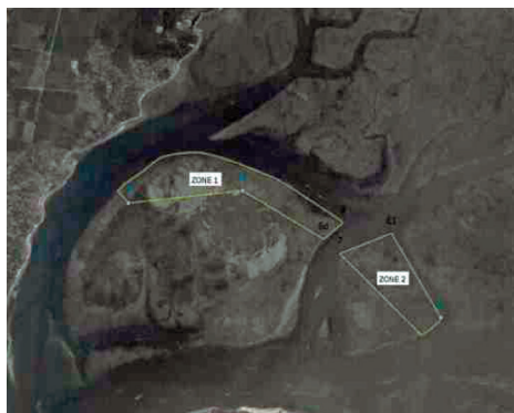
Zones de réserve Palourde