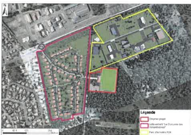
Figure 4 : Vue aérienne du secteur Crabitère après aménagements