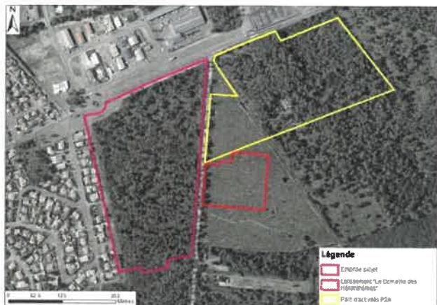
Figure 3 : Vue aérienne du secteur Crabitère avant aménagements