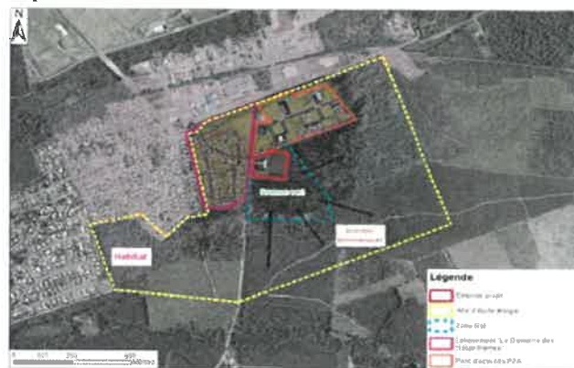
Figure 10 : Présentation de l'aménagement global projeté sur l'ensemble de l'aire d'étude élargie (Fond de carte SDSD / ATAGE)