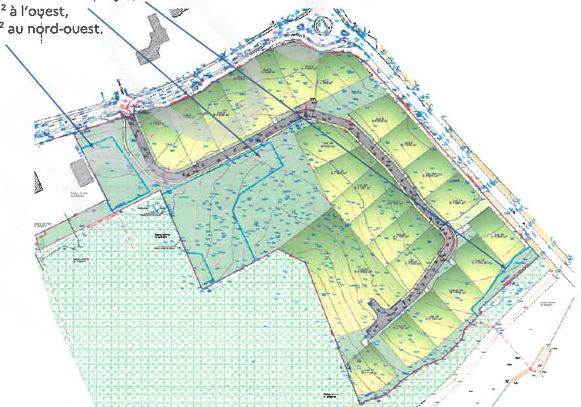
Figure 2 : Localisation des zones humides