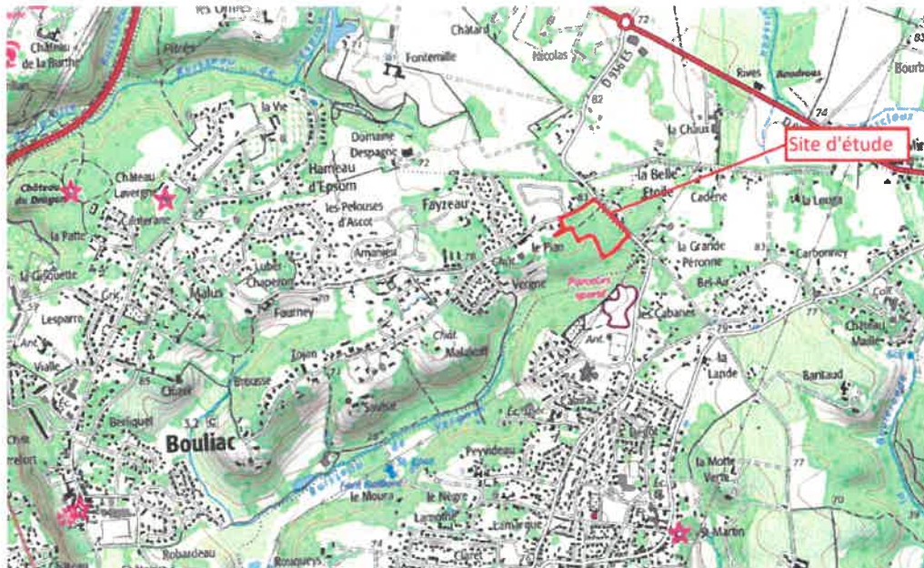
Figure 1 : Localisation géographique du projet

Ce projet d'aménagement est concerné par trois zones humides (ZH) qui seront intégralement évitées tant en phase chantier qu'en phase exploitation.