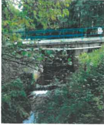
Le Bois de Coufin, non loin du rivage de la mer →