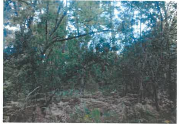
Page 3 sur 4