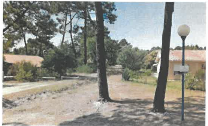
Page 4 sur 4