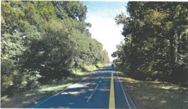
← Coupure d'urbanisation au Sud du port de plaisance de Taussat